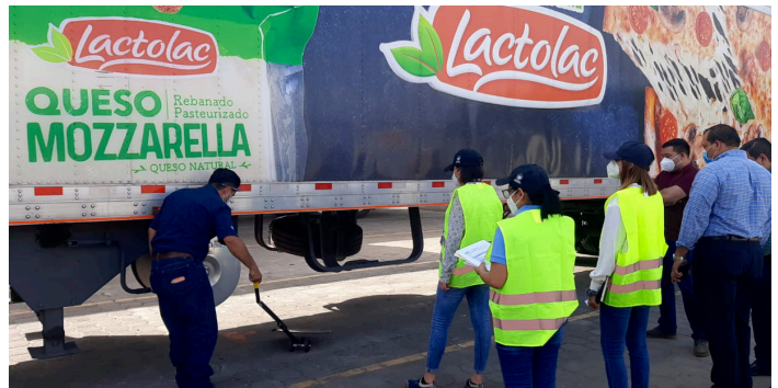
Visita de la DGA a planta de producción, LACTOLAC S.A. DE C.V. en San Salvador, El Salvador.

el Marco Normativo SAFE de la Organización Mundial de Aduanas.