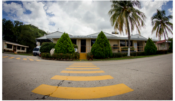
Planta Producción de BEMISAL S.A. DE C.V. Metapán, El Salvador.