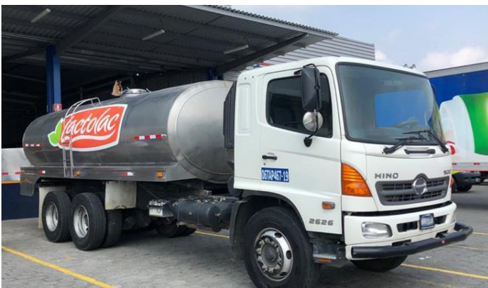
Planta de producción, LACTOLAC S.A. DE C.V. en San Salvador, El Salvador

Dentro del proceso de certificación se validó el cumplimiento de las condiciones y requisitos establecidos en la Disposición Administrativa de Carácter General N° DGA-006-2022 relativa al Programa del Operador Confiable (OEA-SV), con base a los lineamientos determinados en