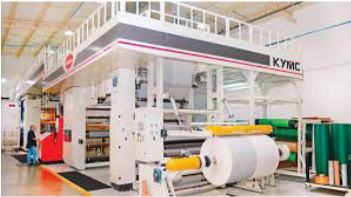
Planta producción de BEMISAL S.A. DE C.V. en Santa Ana, El Salvador